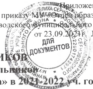
ГРАФИК И СОСТАВ УЧАСТНИКОВ Республиканской олимпиады школьников «Предметная олимпиада им. А.Х. Кадырова» в 2021-2022 уч. году